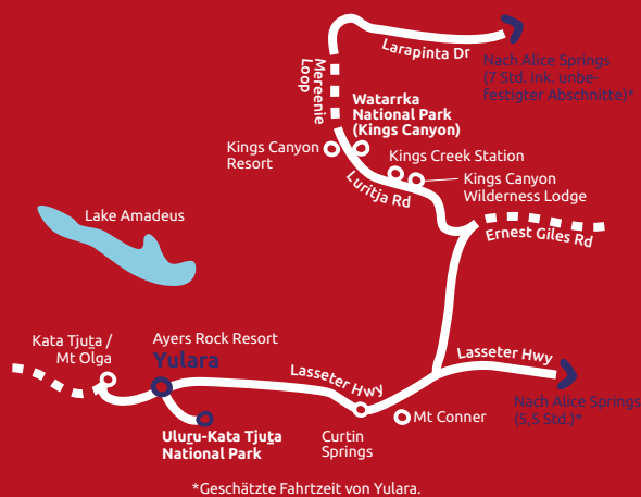
*Geschätzte Fahrtzeit von Yulara.

Wofür Sie sich auch entscheiden, der Anblick des Uluru ist, besonders zum Sonnenauf- und -untergang, atemberaubend. Drei Tage geben Ihnen Zeit, um die Magie des Uluru wirken zu lassen, die Schönheit von Kata Tjuta und die großartigen Panoramaaussichten zu genießen sowie die Bedeutung der Region für die Anangu zu verstehen.