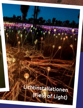
Lichtinstallationen (Field of Light)