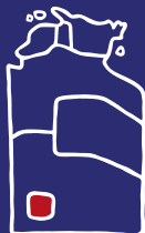
Uluru Helicopter Tour