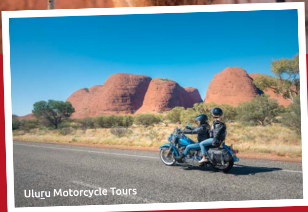
Uluru Motorcycle Tours