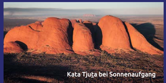
Kata Tjuta bei Sonnenaufgang

Zum Ausklang des Abends sollten Sie den Sonnenuntergang über der spektakulären Landschaftskulisse Zentralaustraliens beobachten.