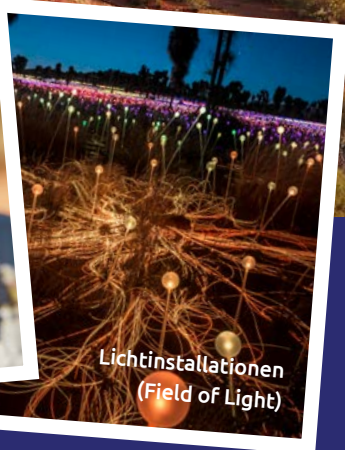
Lichtinstallationen (Field of Light)