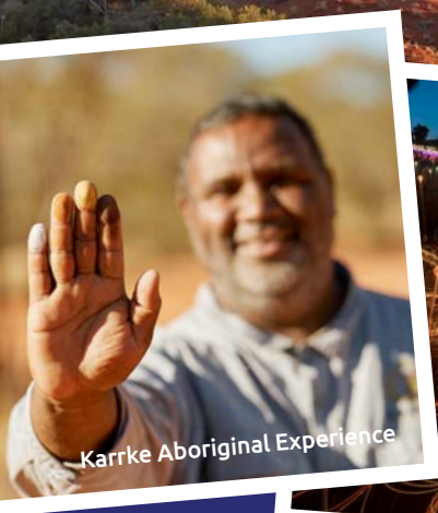
Karrke Aboriginal Experience