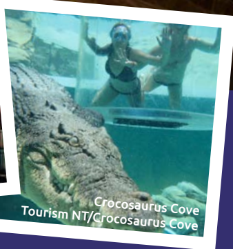
Crocosaurus Cove Tourism NT/Crocosaurus Cove