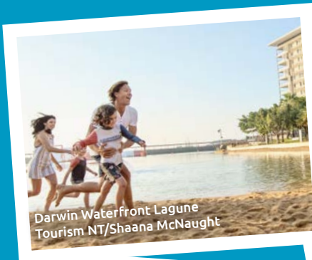
Darwin Waterfront Lagoon Tourism NT/Shanaa McNaught