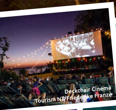
Deckchair Cinema