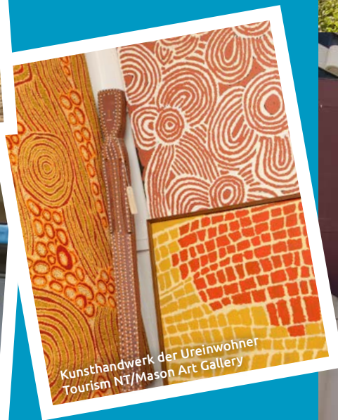
Kunsthandwerk der Ureinwohner Tourism NT/Mason Art Gallery