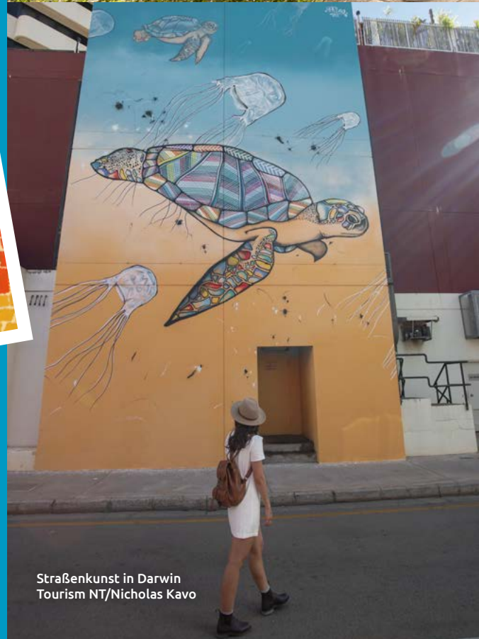
Straßenkunst in Darwin