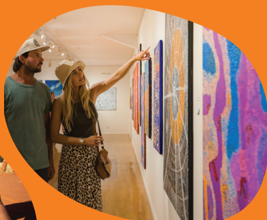
Sopra: Centro d'arte Araluen Sinistra: Esperienza culturale con la Maruku Arts

Si visitano oggi i West Tjoritja (cioè i MacDonnell Ranges occidentali ) partecipando a un tour di un'intera giornata organizzato dai Finke River Cultural Tours e condotto da una guida aborigena attraverso bellissimi panorami rocciosi, intervallati da piscine naturali dove poter rinfrescarsi. La piscina naturale di Rodna e Itopalkara è nota come "la spina dorsale del cane". Esplora l'antichissimo Lirra Pinta (Finke River) e lasciati incantare dalla formazione rocciosa Nthipa, le signore danzanti. Il tour di un'intera giornata viene effettuato in fuoristrada per poter meglio addentrarsi in queste terre del deserto. Si rientra ad Alice Springs nel tardo pomeriggio