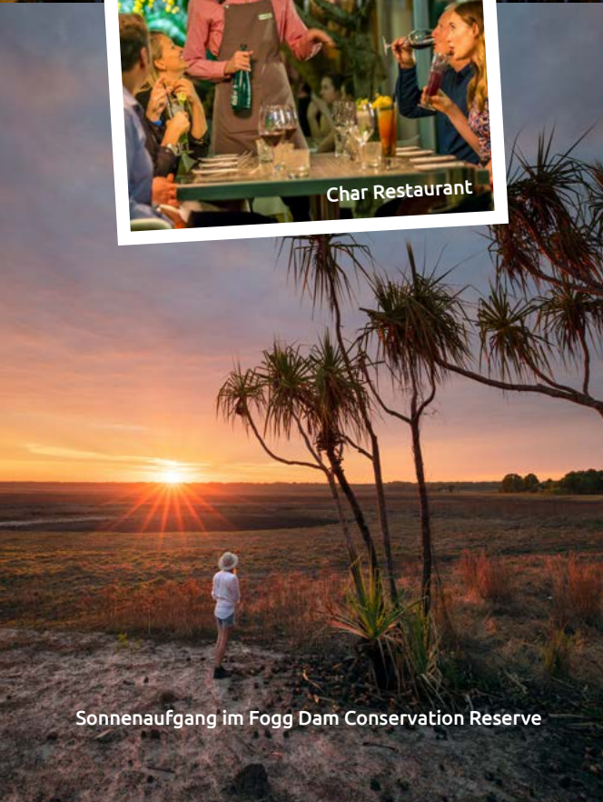
Sonnenaufgang im Fogg Dam Conservation Reserve