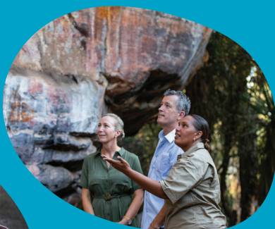
Ci-dessus : Art rupestre à Ubirr, Kakadu A gauche : Nitmiluk Gorge Tour À droite : Grande finale de football des Tiwi Islands et vente annuelle d'œuvres d'art

Rendez-vous sur northernterritory.com Partagez vos photos de voyage #NTAustralia