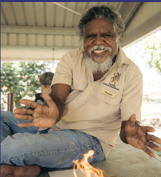
En haut : Pudakul Aboriginal Cultural Tours, région de Darwin Ci-dessous : Top Expérience culturelle Didj, région de Katherine