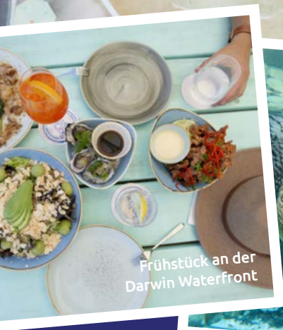
Frühstück an der Darwin Waterfront