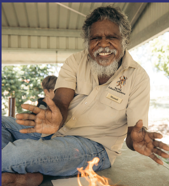
顶部: 达尔文地区 Pudakul 原住民文化之旅 上方: 凯瑟琳地区 Top Didj 文化体验